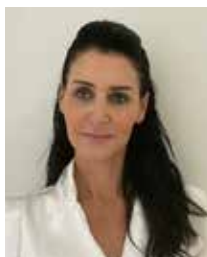
שלהבת בני מנהלת בי"ס הבילויים