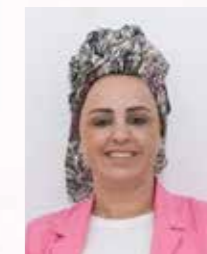
ימימה מיארה מנהלת בייס קשת

בית חינוך משלה לרתיים, מסורתיים וחילוניים